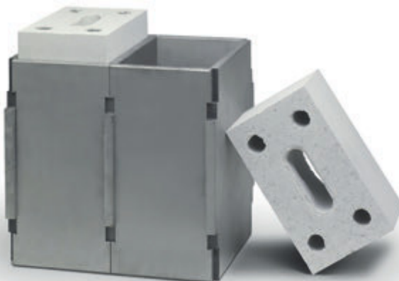
Keine Produktionsstillstände beim Kunden, lange Lebensdauer und eine schönere Steinoberfläche: KS-Formkästen von Martin Schleiftechnik.

Vorbei sind die Zeiten, in denen ein Werkstück einfach nach Vorgabe bearbeitet und wieder zurückgegeben wurde. «Dienstleistung» heisst bei Martin, mitzudenken: Bei der Eingangskontrolle des Auftragsmaterials auf Mängel oder Schwierigkeiten hinzuweisen; Zwischenprodukte zu lagern, zu kommissionieren und direkt an den Bestimmungsort zu liefern; auf der Suche nach der besten Lösung auch mal einen Umweg oder eine Kurskorrektur in Kauf zu nehmen oder ein Verfahren selber weiter zu entwickeln. Ein gutes Beispiel dafür sind Verschleissplatten aus gehärtetem Stahl für Formkästen zur Kalksandsteinherstellung. Das von Martin Schleiftechnik perfektionierte System sorgt für ein Minimum an Produktionsstillständen beim Kunden, lange Lebensdauer der Formen und eine schönere Steinoberfläche.